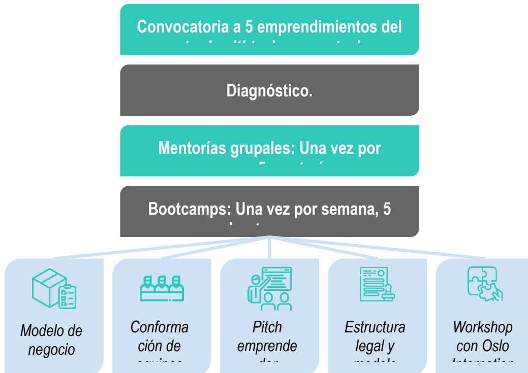
Diagrama del proceso

El proyecto contempla las siguientes fases: